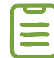
Artículos de opinión